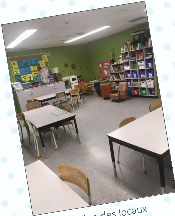
Voici l'un des locaux du service de garde

À l'école de la Grande-Hermine il y a un service de garde où tu pourras venir le matin avant d'aller en classe, sur l'heure du diner, après la classe et lors des journées pédagogiques. Les locaux utilisés par le service de garde sont les classes et quelques autres locaux.