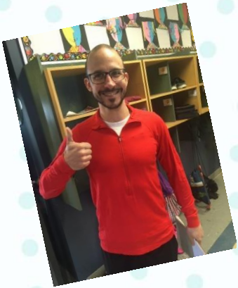
Les enseignants d'éducation physique

Il y a beaucoup de gens qui travaillent dans une école. Peut-être que tu en rencontreras quelques-uns l'an prochain!